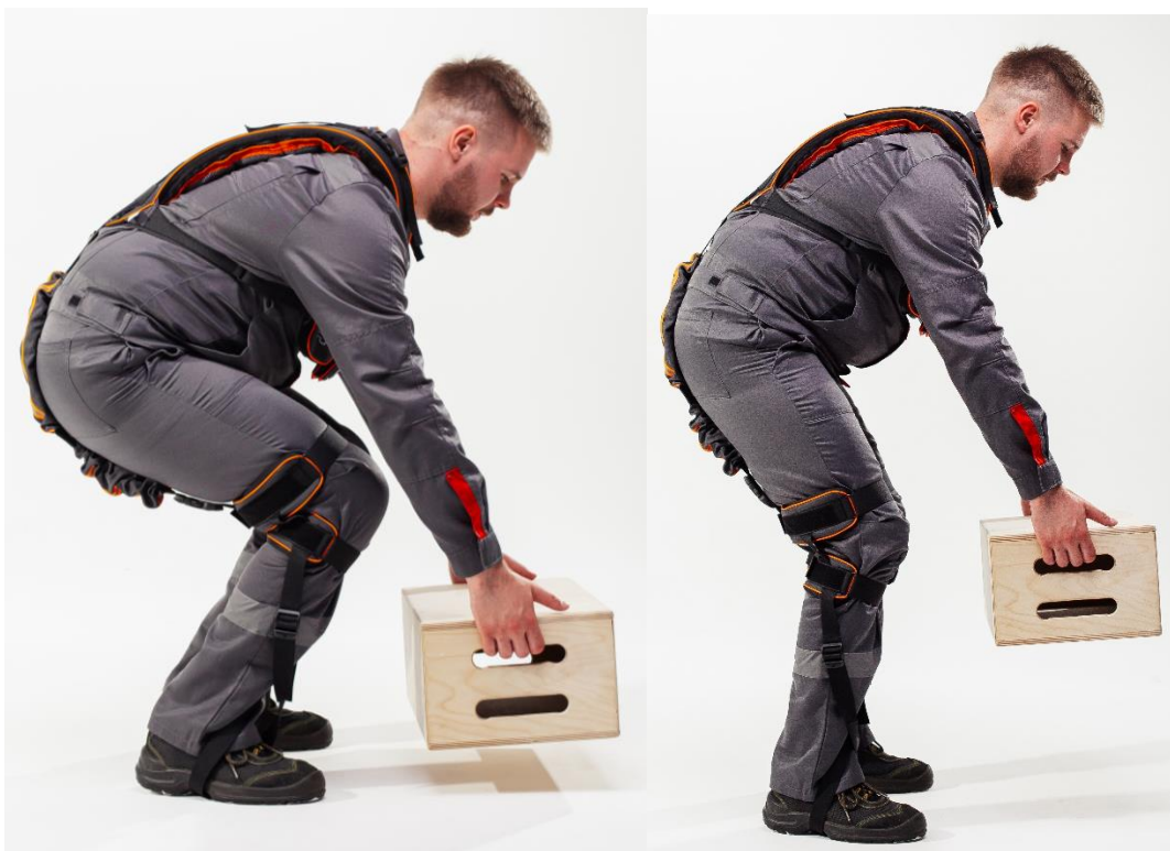
Рисунок 6 – Схема наклонов в экзоскелете

Рекомендуется большую часть работы выполнять ногами, оставляя спину в статическом напряжении. Таким образом эластомер максимально растягивается, а поясница разгружается, тем самым снижается риск получения травмы на производстве. Схема оптимальных углов, при работе в экзоскелете показана на рисунке 6.