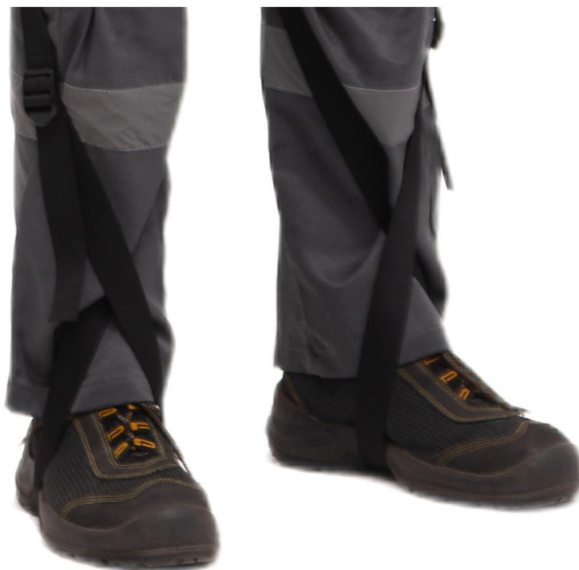
Рисунок 4– Правильная фиксация подпяточной стропы

4. Пользователь затягивает регулировку натяжения эластомера (1), так что бы элемент (5) был в преднатяннутом состоянии.