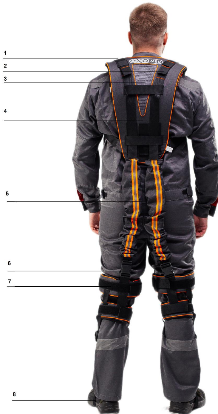
Рисунок 2 – Устройство экзоскелета

На рисунке представлен общий вид экзоскелета Lowebacker в сборе.