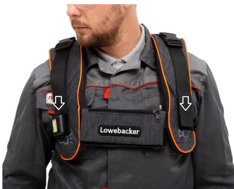
Рисунок 5 – Регулировка натяжения компенсаторов через фастекс

Регулировка натяжения эластомеров требуется для настройки под рост, а также под режим работы оператора. Регулировка осуществляется через стропы специальных регулировочных застежек-фастекс (1), которые располагается на лицевой стороне жилета. Регулировка натяжения осуществляется путем вытягивания стропы передней части жилета, как показано на рисунке 5. Рабочий ход регулировки составляет 25 сантиметров. При нехватке хода регулировки стропы на лицевой части разгрузочного жилета имеется возможность отрегулировать под размер с помощью застежки-фастекса стропу, идущую от компенсатора.