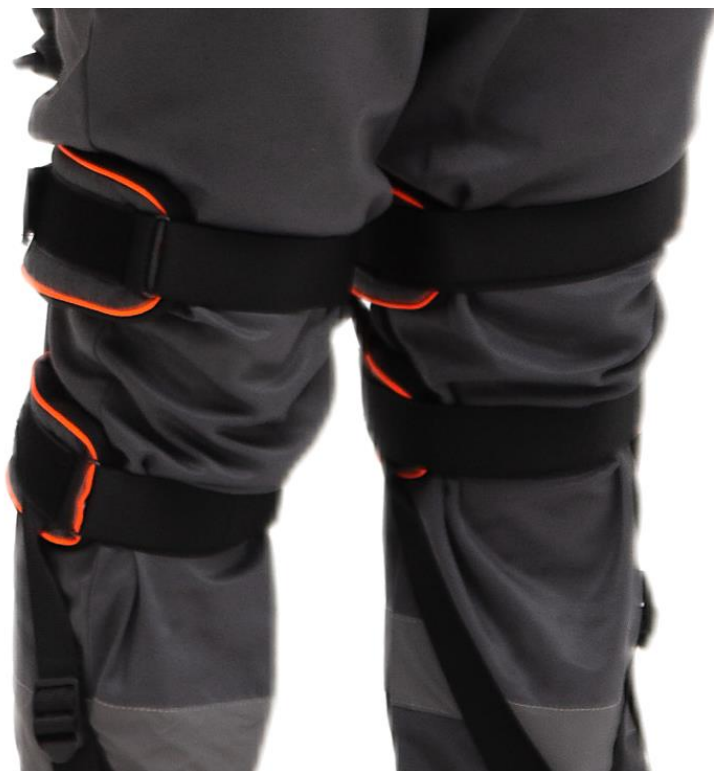
Рисунок 3 –Правильная фиксация коленной манжеты

3. Далее оператор надевает подпяточные стропы (8) на стопе согласно рисунку 4.