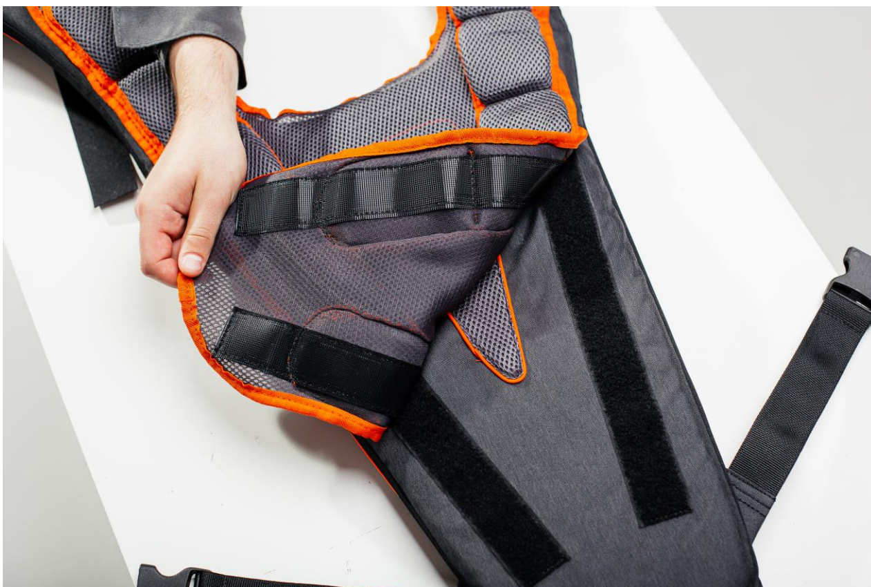
Рисунок 7. Модуль для гигиенической очистки.

Жилет экзоскелета оснащен отстегиваемым модулем ( рис.7) для проведения гигиенической очистки, и работе нескольких операторов.